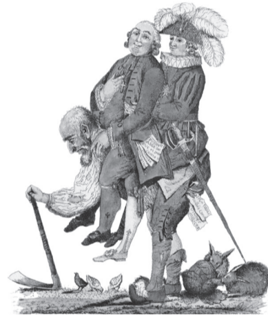
Dobová karikatura, na které chudý lid nese na svých bedrech církev a šlechtu.

Příležitost k projevení vzdoru, nezlomnosti a úcty k popravenému manželovi pojala Marie stylově a po svém. Nechala si ušít několik šatů černé barvy, která byla zakázána, a do jiné barvy se již, navzdory varování, neoblékla. Svého manžela přežila o devět měsíců. Krásná, upravená a hrdá, leč pohublá královna, v bílých prostých šatech s jemným krajkovým kapesníčkem v ruce kráčela za křiku rozvášněného davu 16. října 1793 vstříc gilotině. Na popravišti podala prý katu kapesníček se slovy: „Otřete tu gilotinu, ať mi nezamaže límeček.“