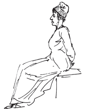
Cesta Marie Antoinetty na popraviště ve vozíku pro odsouzené na autentické skice.

Královna si nikdy nezískala sympatie svých francouzských poddaných, trnem v oku byla i mnoha vlivným lidem u dvora. Kolovalo mnoho pohrdavých přezdivek a drbů, nazývali ji „pyšnou Rakušankou“ nebo dokonce „rakouskou děvku“. Nespravedlivě byla viněna z bankrotu státní pokladny. Přes všechny drahé látky, šperky, bujaré večírky a jiné nákladné koníčky bylo ale hlavní příčinou rozvrácení státní ekonomiky financování amerických kolonií v boji o nezávislost na Británii.